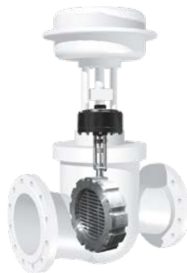
Comparaison de tailles entre une vanne à siège normale et une vanne de régulation à glissières Schubert & Salzer. Les deux vannes ont ici un diamètre nominal identique.