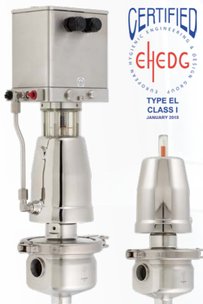
Vanne d'équerre aseptique type 6051: